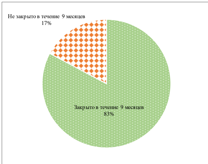
Диаграмма II Процентная доля дел, закрытых в течение девяти месяцев в 2018 году

67. На диаграмме III показана процентная доля дел, закрытых в девятимесячный срок, в разбивке по категориям дел. Из диаграммы видно, что на скорость закрытия дел влияет ряд факторов, включая характер дела (например, все дела о сексуальной эксплуатации и сексуальных надругательствах были закрыты в девятимесячный срок) и его относительная сложность (например, разбор дел о мошенничестве с участием третьих сторон обычно занимал больше времени, чем разбор дел о мошенничестве, совершенном персоналом при получении пособий и льгот).