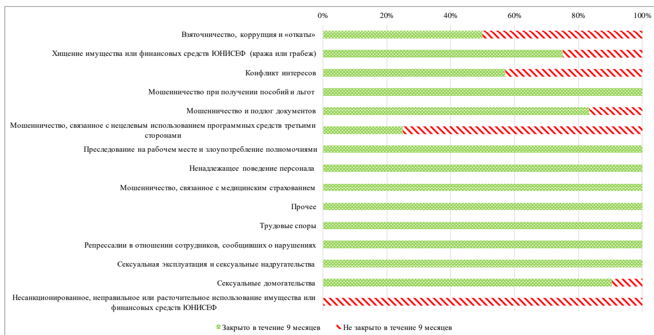
Диаграмма III Процентная доля дел, закрытых в течение девяти месяцев, в разбивке по категориям, 2018 год