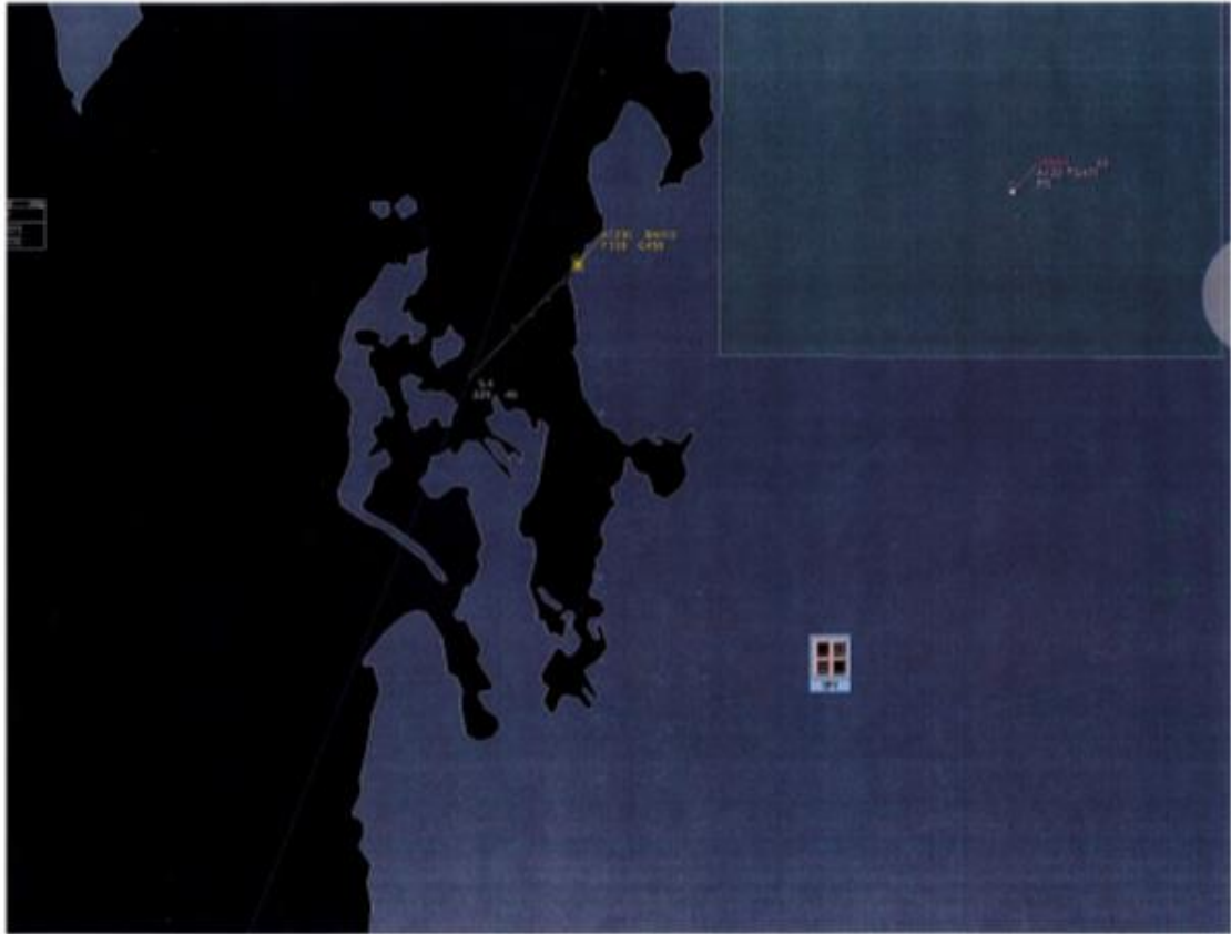
ВАН10 at FL338 (A1230) (date: 27 Dec 2018)

Самолет (позывной ВАН-10) в точке FL 338 (A1230) (дата: 27 декабря 2018 года)