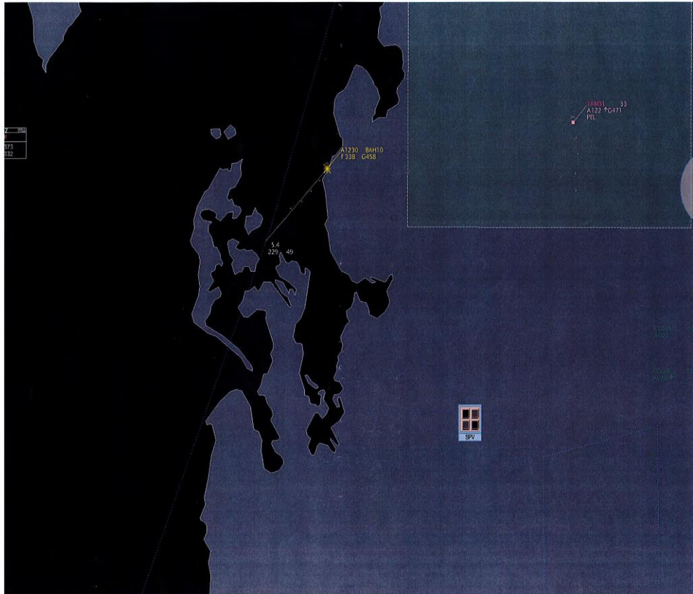
BAH10 at FL338 (A1230) (date: 27 Dec 2018)