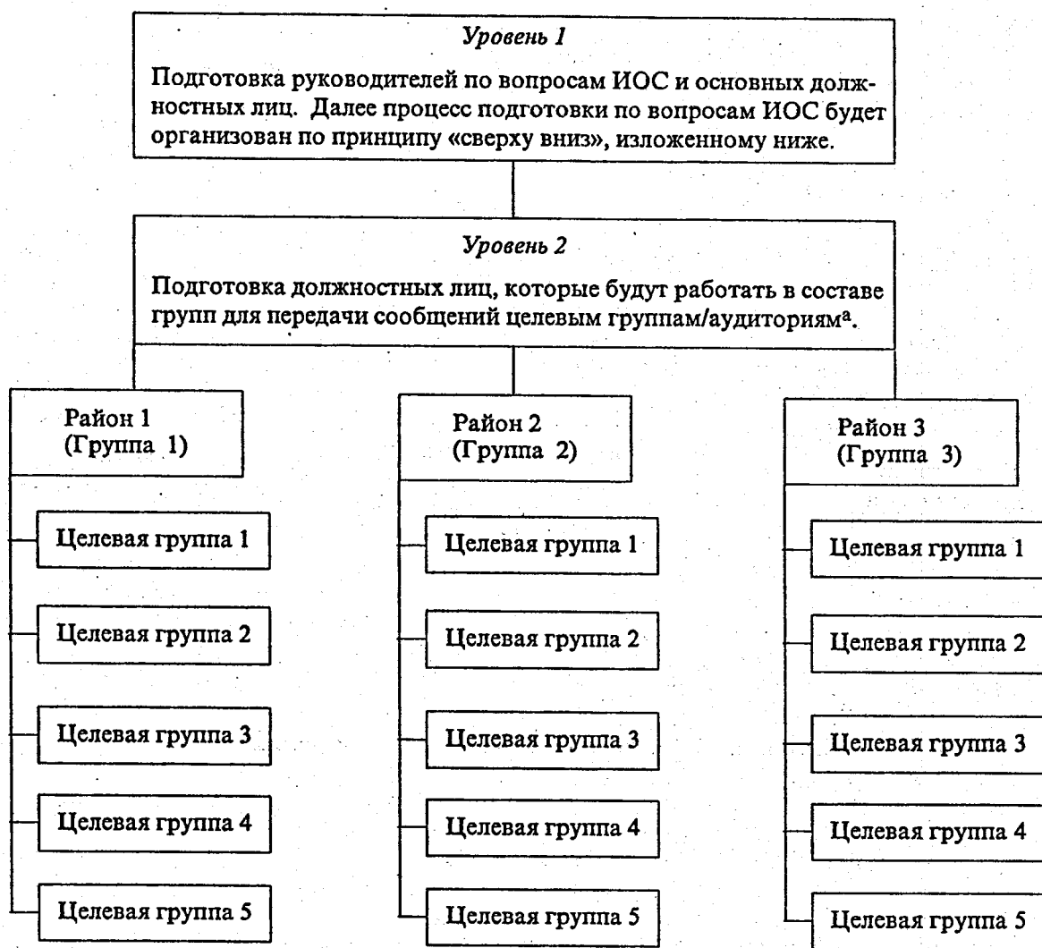
Схема 3. Схема процесса подготовки по вопросам ИОС