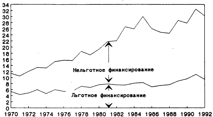
Рисунок III. Многосторонние обязательства в области развития, 1970-1992 годы (в млрд. долл. США в ценах 1980 года)

Источник: Департамент по вопросам экономической и социальной информации и анализа политики Секретариата Организации Объединенных Наций на основе информации отдельных учреждений.