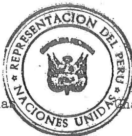
James Victor Gheno Embajador

Encargado de Negocios a.i. del Perú ante las Naciones Unidas