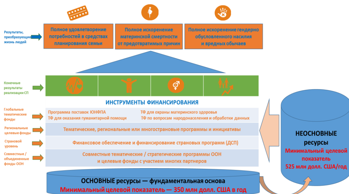
Диаграмма 1. Архитектура финансирования ЮНФПА

21. Успех структурированных диалогов по вопросам финансирования будет зависеть от выполнения всеми сторонами своих обязательств по обеспечению реализации устойчивых подходов к финансированию, с тем чтобы никто не остался забытым и чтобы в первую очередь оказать помощь самым обездоленным.