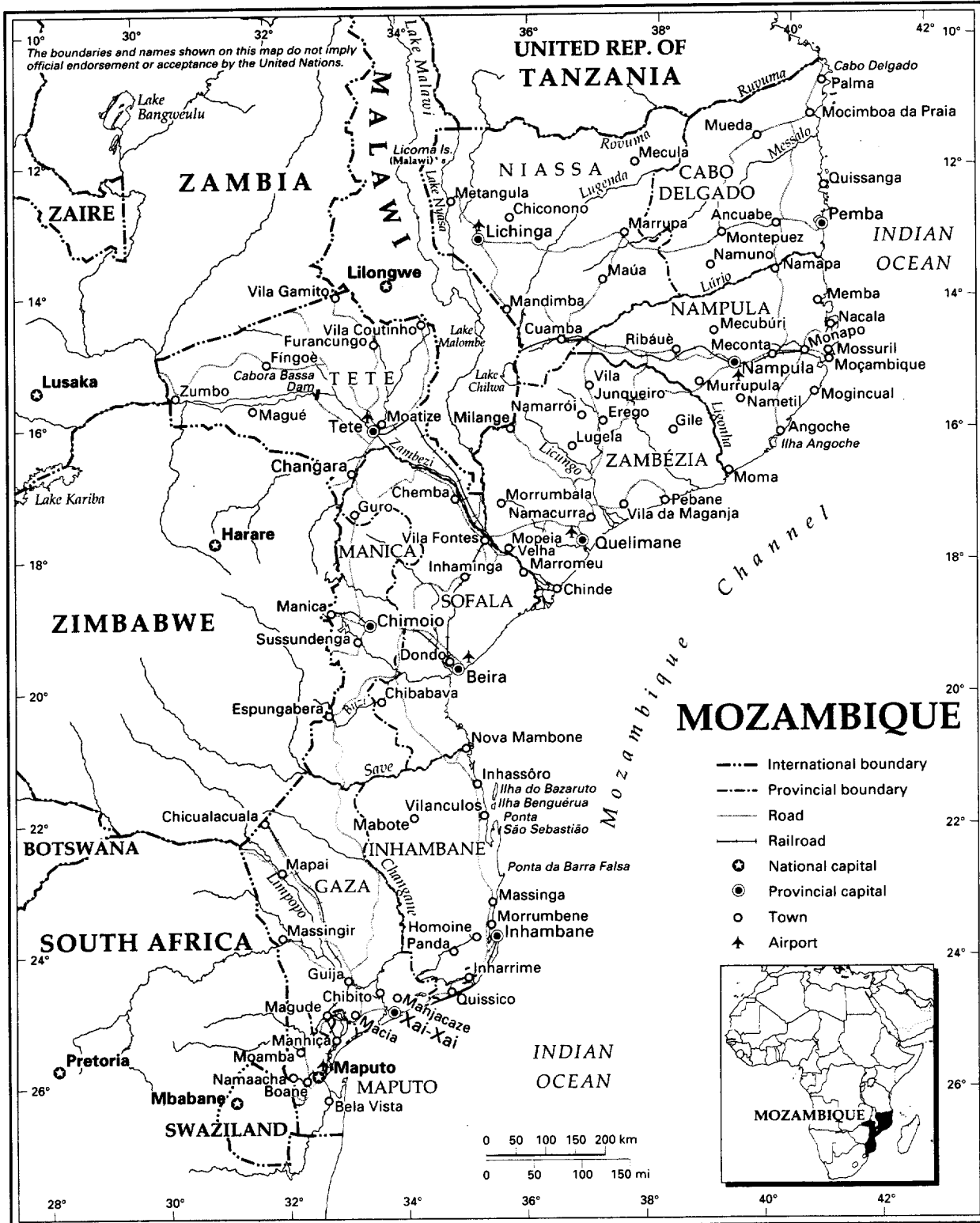
MAP NO. 3706 UNITED NATIONS