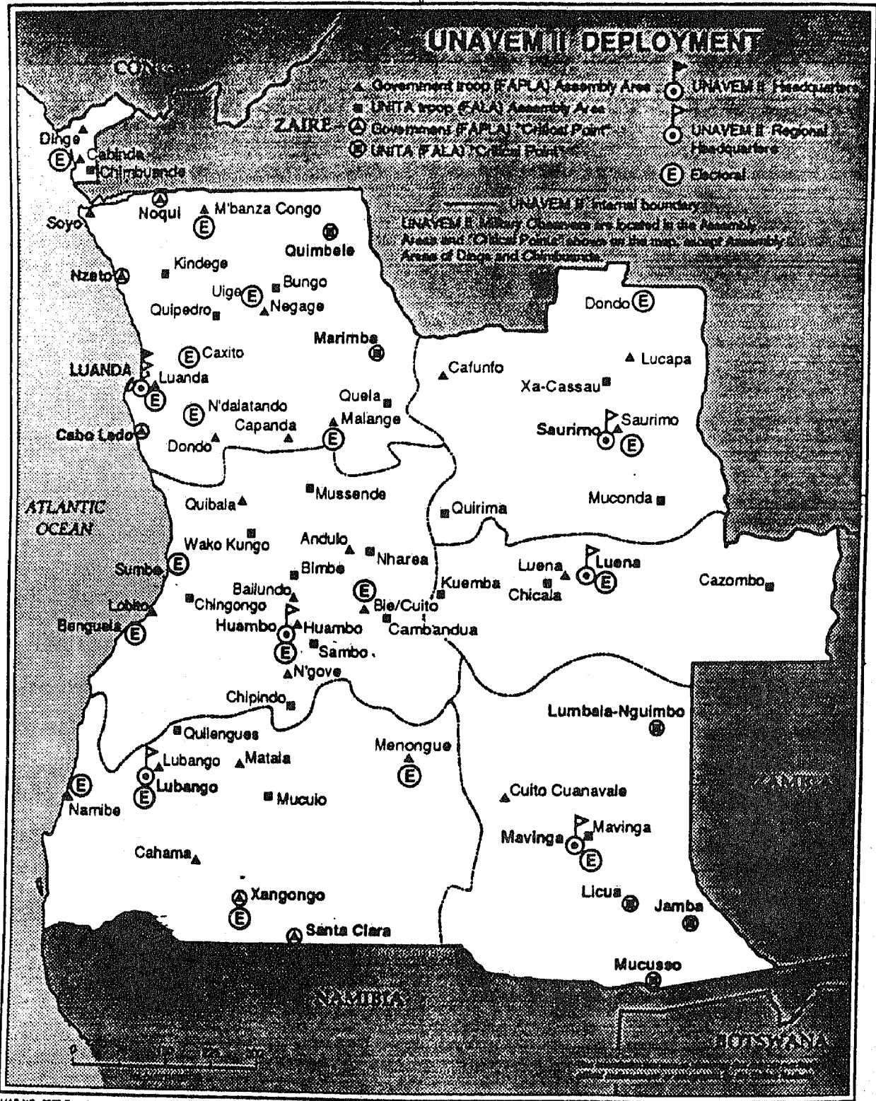
安哥拉第二期核查团部署图