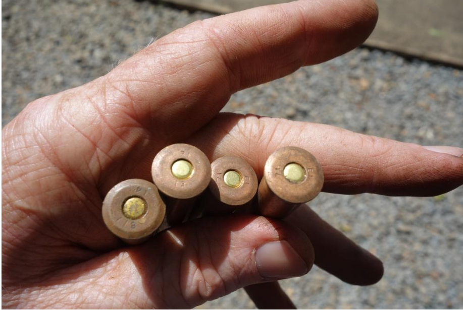
Figure XVII: Sample of 7.62x52Rmm ammunition