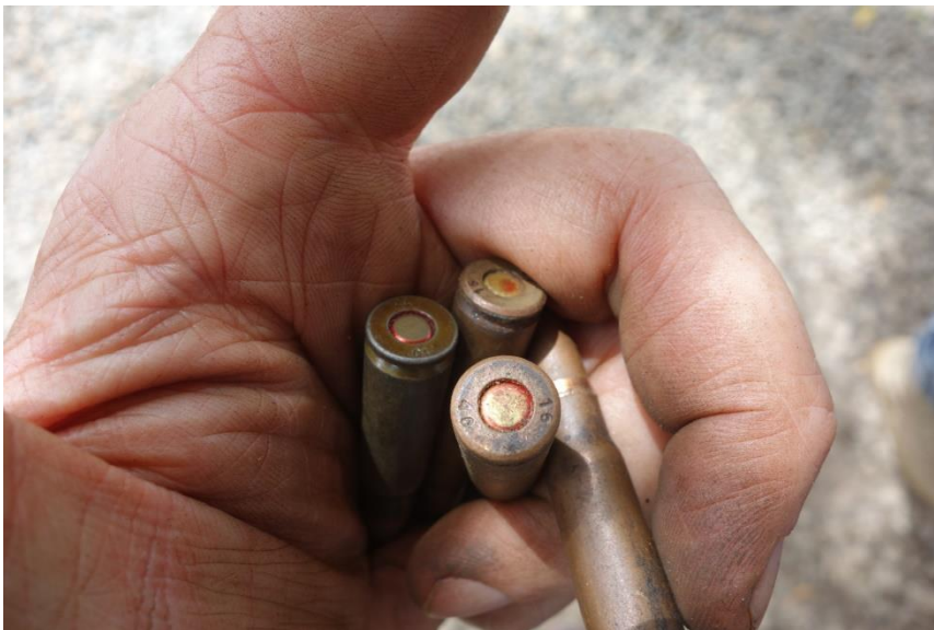
Figure XVI: Sample of 7.62x39mm ammunition