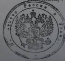
Weapons transport document, page 2