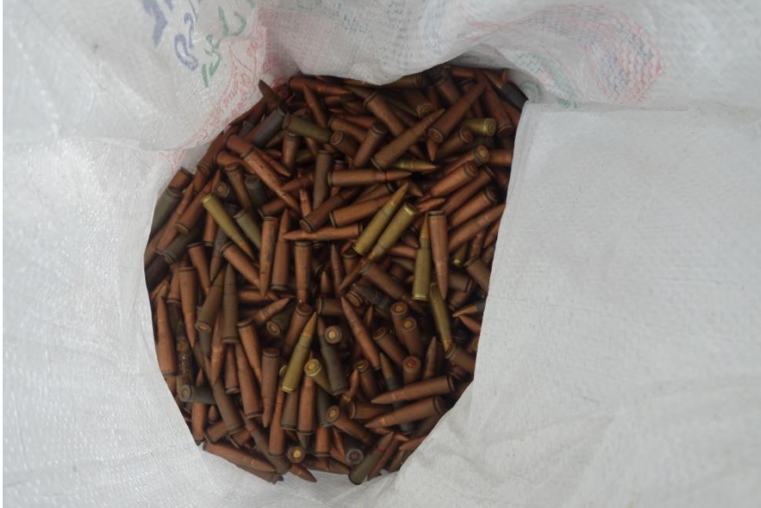
Figure XV: Rounds of 7.62mm ammunition seized by UNMISS in July 2016

The Panel also examined the more than 3,000 rounds of ammunition also seized by UNMISS in July 2016. However, given the time available and the number of rounds and diversity of the sources of manufacture, it was not possible to document every piece of ammunition. As the rounds are without their packaging, tracing them to their first consignee is impossible. Nevertheless, the examination indicates that none of the ammunition was manufactured after 2015.