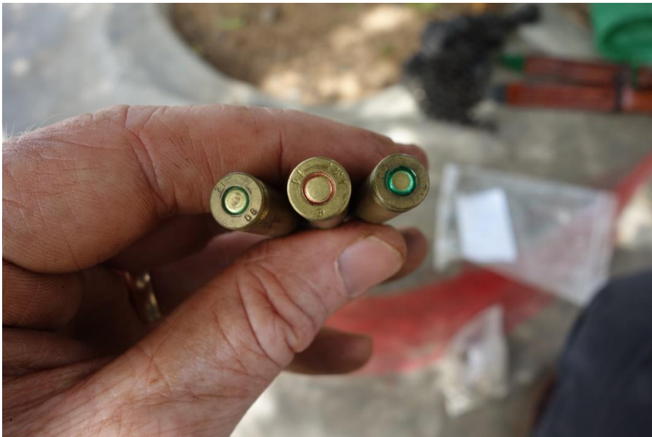
Figure XVIII: Sample of 5.56mm ammunition