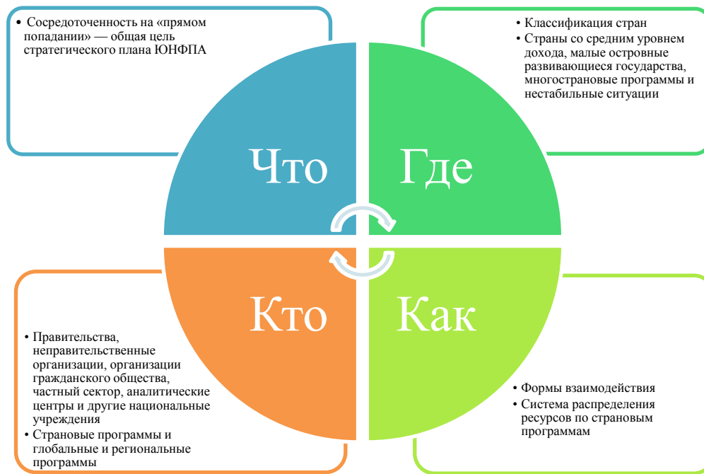
Диаграмма 4. Четырехкоординатная модель организации рабочих процессов ЮНФПА

42. Элемент «что» будет охватывать все аспекты концепции «прямого попадания» — общей цели стратегического плана — с корректировками в целях его согласования с Повесткой дня на период до 2030 года.