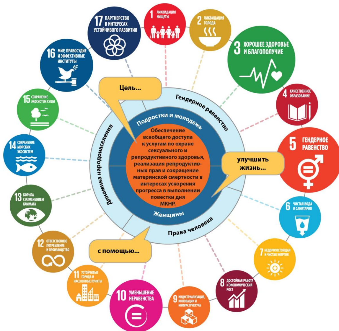
Диаграмма 1. Обеспечение согласованности концепции «прямого попадания» — общей цели стратегического плана ЮНФПА — с целями и показателями Повестки дня в области устойчивого развития на период до 2030 года

ЮНФПА придаст новый импульс работе по выполнению этой Программы действий, способствуя достижению общей цели своего стратегического плана и, в конечном итоге, искоренению нищеты. В рамках этого согласования ЮНФПА придает первостепенное значение 17 показателям, предусмотренным в Целях устойчивого развития. Диаграмма 1 иллюстрирует соответствие стратегического плана ЮНФПА Целям устойчивого развития.