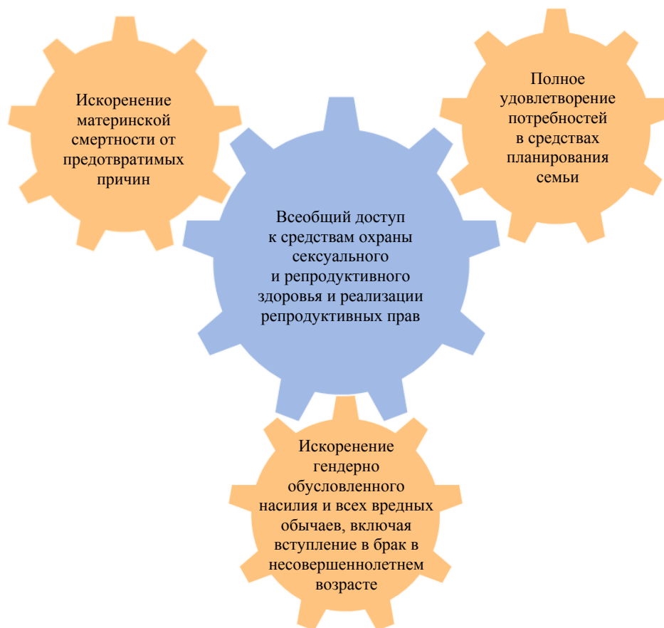
Диаграмма 2. Всеобщие и сосредоточенные на нуждах людей конкретные результаты преобразований