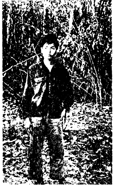
أمسي ، ٣٦ سنة