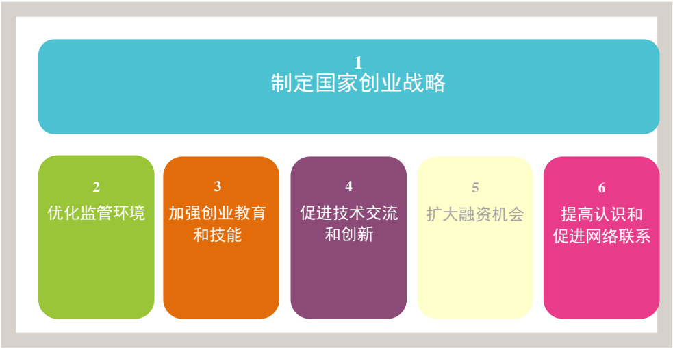
图 1 贸发会议创业政策框架的重要组成部分