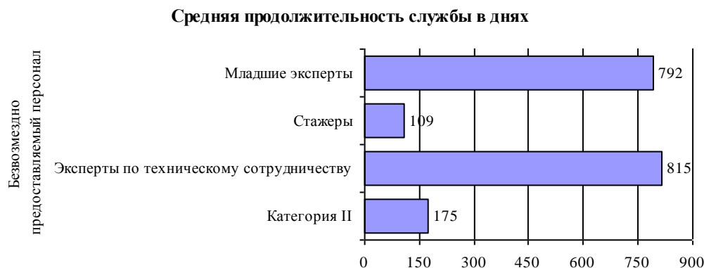
Диаграмма II Наем безвозмездно предоставляемого персонала в разбивке по средней продолжительности службы в днях: 2012–2013 годы (Контингент: 4531 контракт)