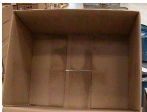
Photo 4: Intérieur de l'emballage extérieur sans les emballages intérieurs au bout de 960 min