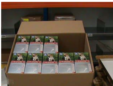
Photo 2: Caisse remplie d'emballages intérieurs ayant reçu un volume total de 1,920 ml d'eau