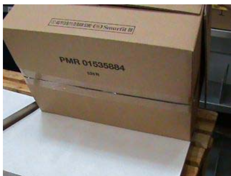
Photo 5: Vue extérieure de l'emballage extérieur au bout de 960 min