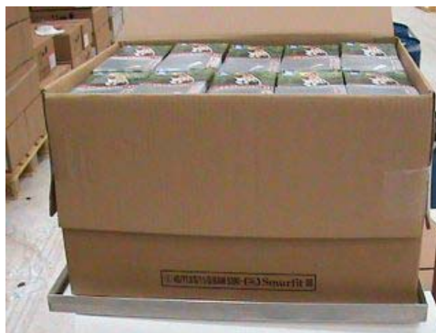
Photo 3: Aspect de l'emballage extérieur et des emballages intérieurs au bout de 960 min