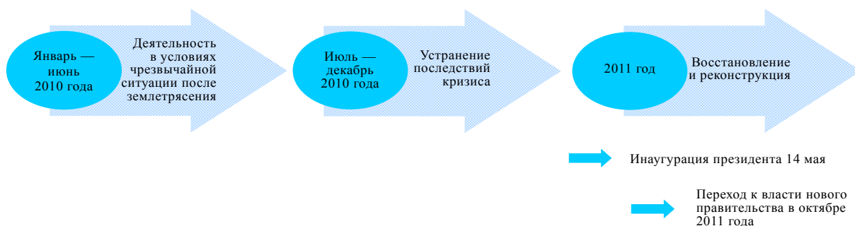
Диаграмма I График работы МООНСГ в период 2010–2011 годов