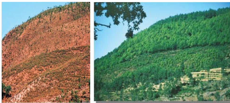
Avant et après : foresterie communautaire au Népal : le passage du gris au vert

10. L'évolution des droits fonciers s'est effectuée en trois phases au Népal. Tout d'abord, il y a eu un transfert de la propriété publique et privée et de l'accès ouvert à la gestion collective. Cela a été possible par le biais de contrats de concession communautaire établis et suivis par le Gouvernement népalais qui a octroyé des droits d'usufruit aux entités collectives. Ensuite, des textes de loi ont été mis en place par les autorités afin d'octroyer des droits fonciers aux communautés titulaires de contrats de gestion de terres. La planification et la gestion de ressources forestières spécifiques, comme le xaté (plante à palmes décoratives), le quatre-épices et le caoutchouc, requerraient également une action collective, permettant à des sous-groupes de s'organiser dans le cadre d'un groupe élargi associé à une concession communautaire. La promotion et la légalisation de la gestion collective des forêts peuvent également être considérées comme une mesure stratégique prise par le Gouvernement afin d'assurer ses droits d'aliénation et d'utilisation de ressources non renouvelables (comme le pétrole et le gaz). Les communautés continuent de s'efforcer d'améliorer la sécurité des droits de propriété qu'elles détiennent.