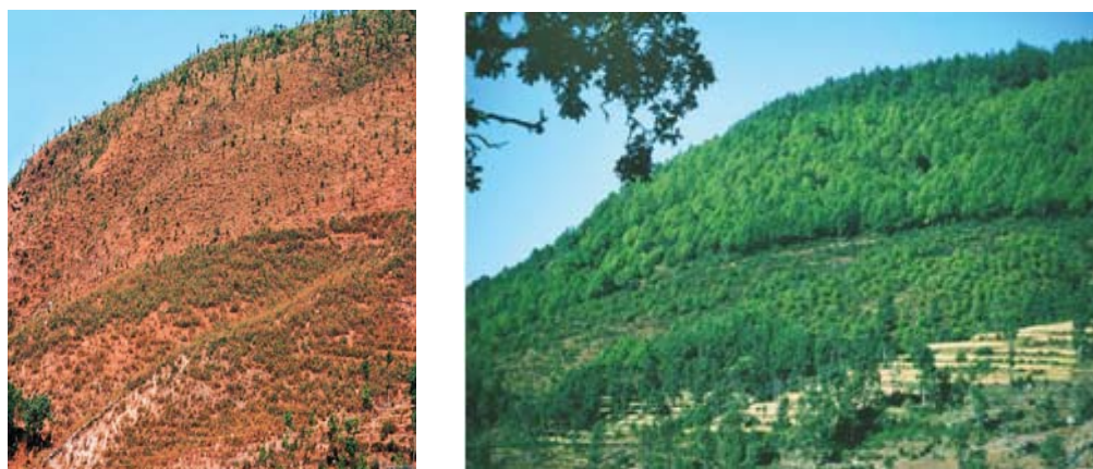
Antes y después del programa forestal comunitario de Nepal

10. En Nepal cabe distinguir tres fases en la evolución de los derechos de tenencia de tierras. En un primer momento se pasó de la propiedad pública y particular y el libre acceso a la gestión colectiva. Ello fue posible gracias a los contratos de concesiones comunitarias, que el Gobierno de Nepal adoptó y aplicó con perseverancia, en virtud de los que se asignaban derechos de usufructo a entidades colectivas. A continuación, el Gobierno aprobó legislación que otorgaba derechos sobre las tierras a las comunidades con las que había concertado contratos de gestión. Por último, la planificación y la ordenación de determinados recursos forestales, como el xate (palma decorativa), la pimienta dulce y el caucho, requirió la adopción de medidas colectivas, lo que permitió organizar subgrupos dentro de la colectividad de miembros más amplia que participaba en la concesión comunitaria. La promoción y la legalización de la gestión colectiva de los bosques también puede considerarse una intervención estratégica del Gobierno para asegurar al Estado derechos de expropiación y utilización de recursos no renovables como el petróleo y el gas. Las comunidades siguen tratando de incrementar la seguridad de los derechos que tenencia sobre las tierras a su cargo.