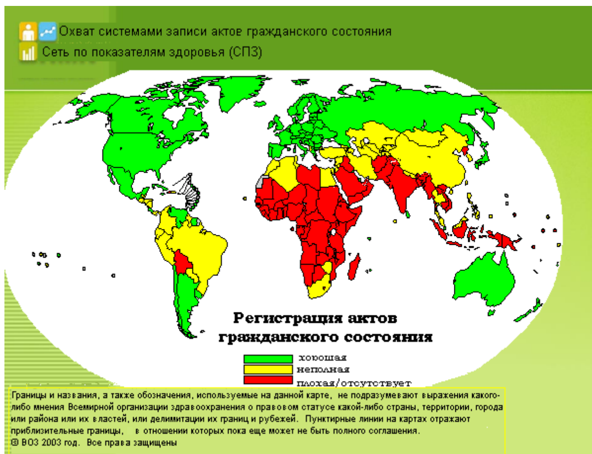
Диаграмма 1. Глобальный охват системами записи актов гражданского состояния, около 2000 года

15. Что касается нынешних и будущих моделей смертности, то интересно обратить внимание на оценочные данные о 20 основных причинах смерти в мире в 2004 году, представленные в таблице 1, и сравнить их с предсказаниями ВОЗ на 2030 год. Такие глобальные прогнозы в отношении показателей смертности основываются на исторически сложившихся связях между тенденциями в социально-экономическом развитии и имеющимися данными о конкретных причинах смертности, которые можно получить из записей актов гражданского состояния и на основе методов вербальной аутопсии. Несмотря на тот факт, что эти прогнозы основывались на предположении о том, что ситуация не будет меняться, и поэтому они не учитывают возможные изменения лежащих в основе факторов риска (за исключением потребления табака), интересно отметить, что за исключением ишемической болезни сердца (сердечные приступы), цереброваскулярной болезни (инсульт) и цирроза печени, все другие указанные заболевания должны, как предполагается, поменять места. Ввиду предполагаемых дополнительных достижений в деле выявления и лечения диарейные заболевания переместятся с 5-го на 23-е место, а туберкулез – с 7-го на 20-е.