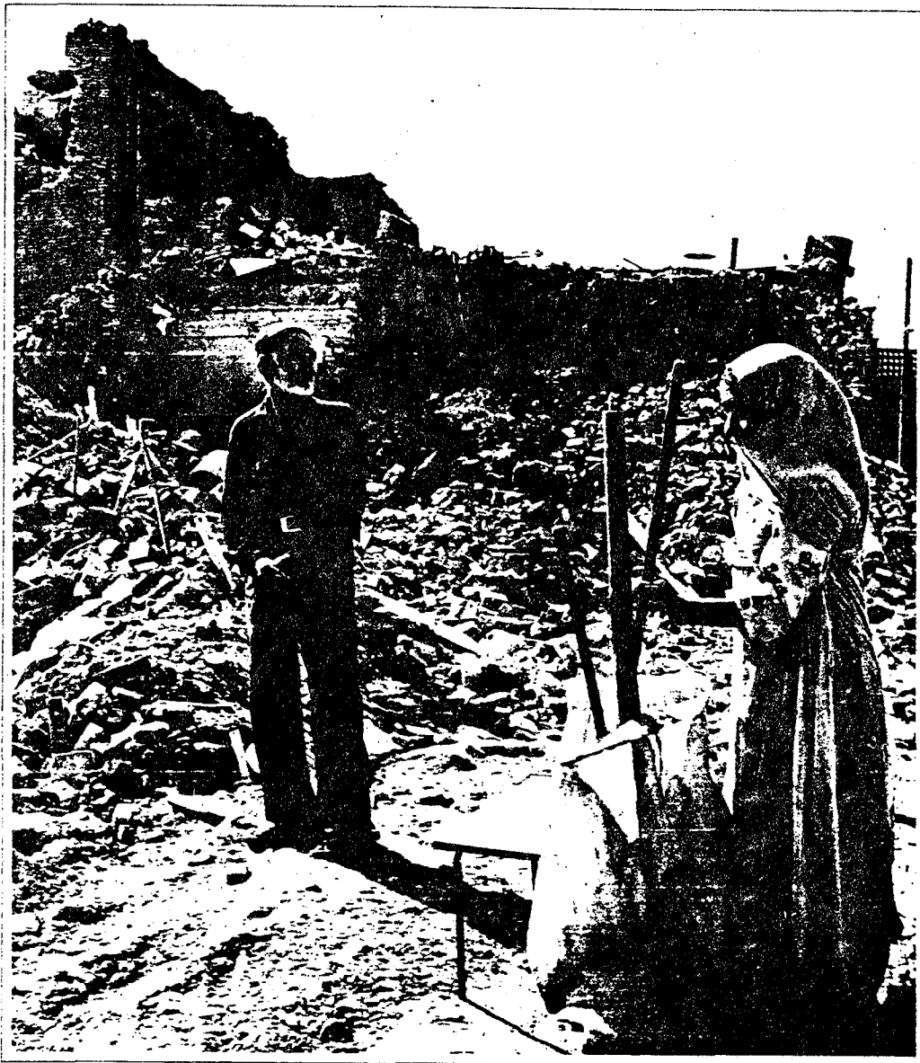
部 总 战

提斯孚尔，1983年9月30日—提斯孚尔镇两名老人。早一天晚上，三枚苏制伊拉克火箭击中这里的住宅区，毁坏了他们多年居住的屋子，导致三个家人死亡。火箭袭击是在早上2时20分发生的，大概是从仍然被伊拉克侵略者占领的伊朗边境领土“法克”（离提斯孚尔80公里）发射的。这项罪行夺去了52个平民的生命，造成120人受伤，直至最近一次的发掘为止，仍有12人失踪。这场袭击完全毁坏了100个居住单位，另外100个居住单位部分损毁。提斯孚尔人民在伊拉克发动的这场战争中进行了不屈不挠的反抗，因而屡次受到伊拉克的攻击。