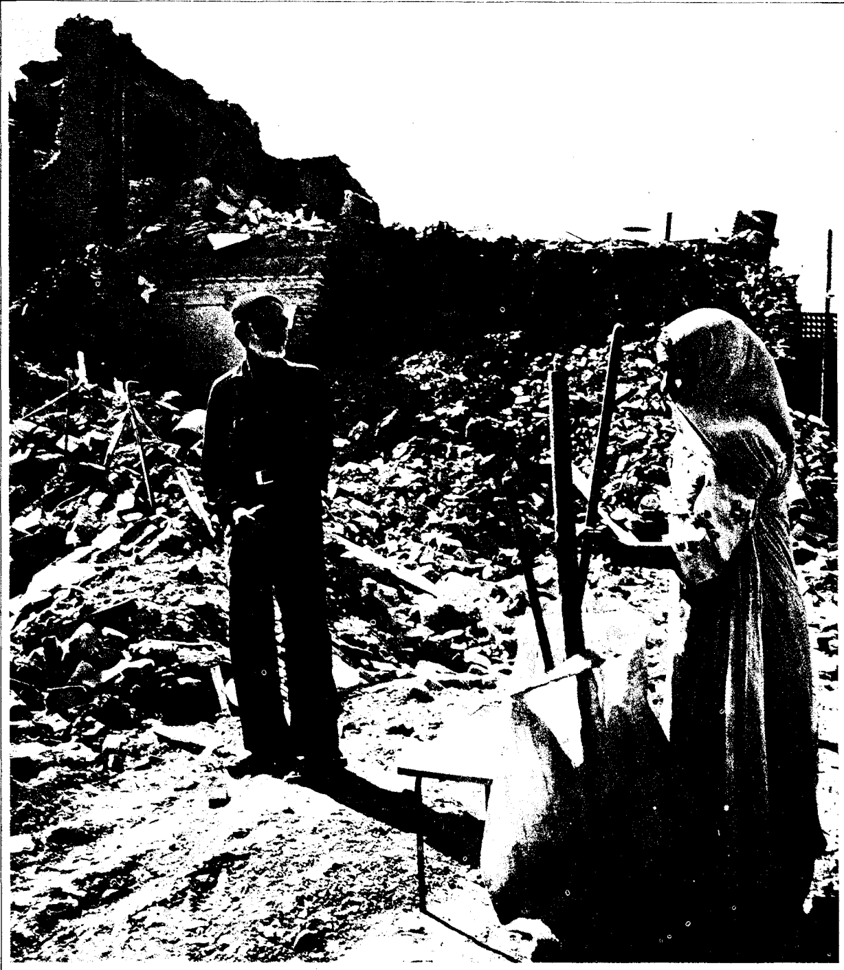
War Information Headquarters

ديزفول ٣٠٠٠ ليلول / سبتمبر ١٩٨٣ - سواطون في سيزفول قتل ثلاثة من أعضاء أسرته بعد أن سيزفول الذي عاش فيه حتى الليلة السابقة . وقد دمر المنزل بعد أن أصابت ثلاث قذائف عراقية مبانى في الاتحاد السوفياتي الأحياء السكنية . وقد أطلقت القذائف في الساعة ٠٢/٢٠٠٠ ورمسا أطلقت القذائف من " فكة " التي تقع داخل الحدود الإيرانية (على بعد ٨٠ كم من ديزفول) والتي ما زال يحتلها المستبدون العراقيون . وقد أدى هذا العمل الاجراسي الى مقتل ٥٢ مدنيا وإصابة ١٢٠ آخرين بجراح . كما دمر المستبدون العراقيون ١٠٠ وحدة سكنية تدميرا تاما وأصيبت ١٠٠ وحدة سكنية أخرى ببعض الأضرار . وما زال ١٢ مدنيا مفقودين حتى اليوم من أيام الحفر . بل قد تعرضت ديزفول للهجمات مرارا بالنظر الى الحالة البائسة التي أوداها مواطنوها أثناء الحرب التي فرضتها العراق .