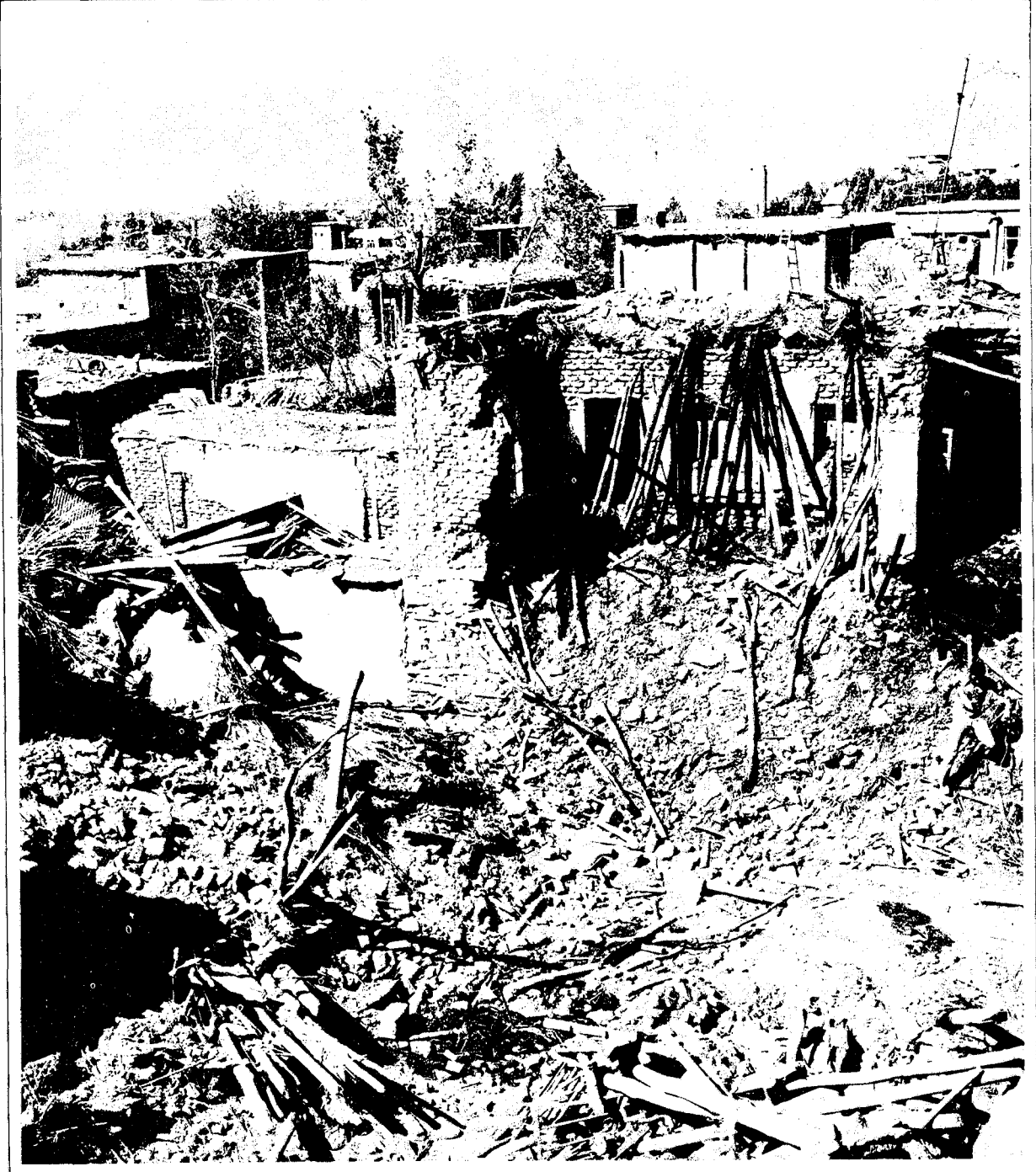
War Information HQ. Supreme Defence Council