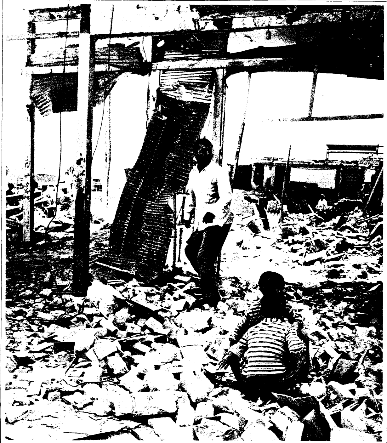
War Information Headquarters

اند يشك ، ٣٠ ايلول / سبتمبر ١٩٨٣ - أنقاض الأحياء السكنية الكثيفة السكان في اند يشك ، في جنوب ايران ، على بعد ٨٠ كم من الحدود ، التي تعرضت لإصابة من إطلاق قذيفتين من صنع الاتحاد السوفياتي في الساعة ٢/٠٠ ، عندما كان المدنيون يغطون في النوم . وقد استشهد في هذا الهجوم ٢٦ شخصا وأصيب ١٢٠ آخرون بجراح ودمر ٦٠ منزلا تدويرا تاما و ١٢٠ منزلا آخر تدويرا جزئيا . وقد قصف العراقيون وأطلقوا قذائفهم على اند يشك عدة مرات وشنوا آخر هجوم لهم في ١٣ آب / اغسطس ١٩٨٣ . وفي أعقاب عمليات فال - فجر ٣ التي حررت بعض الأجزاء الشمالية الغربية من اراضي ايران وحاصرت حاج عمران في العراق ، وقد أدى الهجوم العراقي الى قتل ٤٠ شخصا وإصابة ٢٠٠ آخرين بجراح .