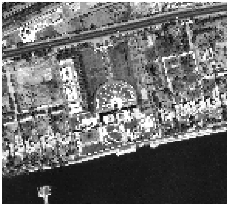
Рисунок А.2. Пространственная разрешающая способность — 5 метров