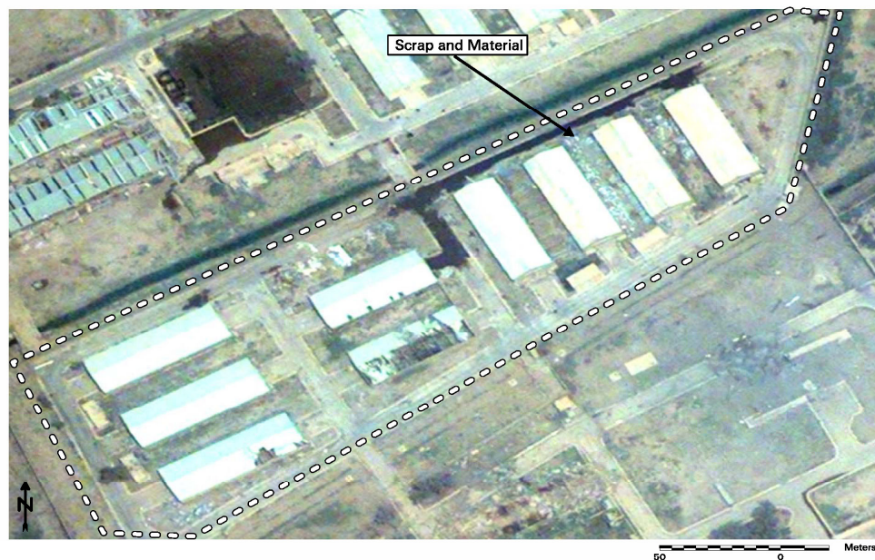
Рисунок А.4. Общий вид хранилища в Шумохе (28 мая 2003 года)