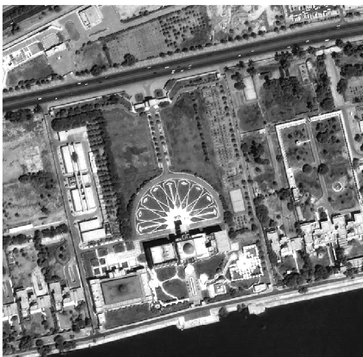
Рисунок А.3. Пространственная разрешающая способность — 1 метр

4. Для картографирования и создания линейных диаграмм ЮНМОВИК чаще всего использует спутниковые снимки, пространственная разрешающая способность которых составляет 1 метр и 0,6 метра. Используются и другие спутниковые снимки — с большей пространственной разрешающей способностью. Поскольку снимки с большей пространственной разрешающей способностью позволяют получать общие изображения больших по площади районов или даже целой страны, они идеально подходят для составления карт или диаграмм более крупного масштаба.