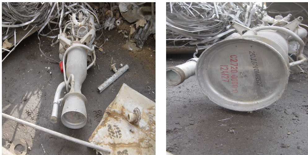
Двигатель ракеты SA-2, обнаруженный на свалке металлического лома в Роттердаме, Нидерланды

«Ирак» или «Багдад». Эксперты ЮНМОВИК на месте обследовали и с помощью портативных приборов для анализа металлов исследовали ряд предметов, в результате чего было установлено, что они состоят из инконеля и титана, представляющих собой материалы двойного использования и подпадающих под режим наблюдения. Был сфотографирован еще ряд предметов, на которых имелись надписи на арабском языке.