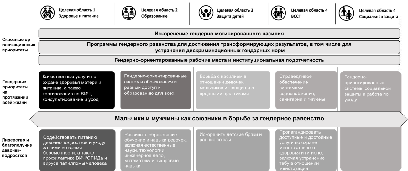
Рисунок I. План действий по обеспечению гендерного равенства на 2022–2025 годы: программные приоритеты

9. ЮНИСЕФ продолжал добиваться успехов в улучшении показателей здоровья женщин и девочек, обеспечивая общий прогресс в предоставлении услуг, расширяя укрепление систем здравоохранения, поощряя обращения за медицинской помощью, укрепляя партнерские отношения с местными сетями женщин и девочек и используя цифровые информационно-просветительские услуги и способы их предоставления.