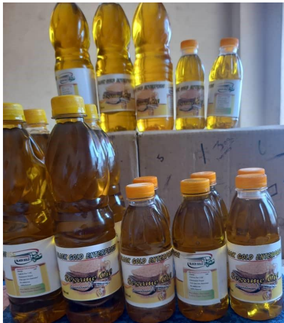
图二 黑金芝麻籽油