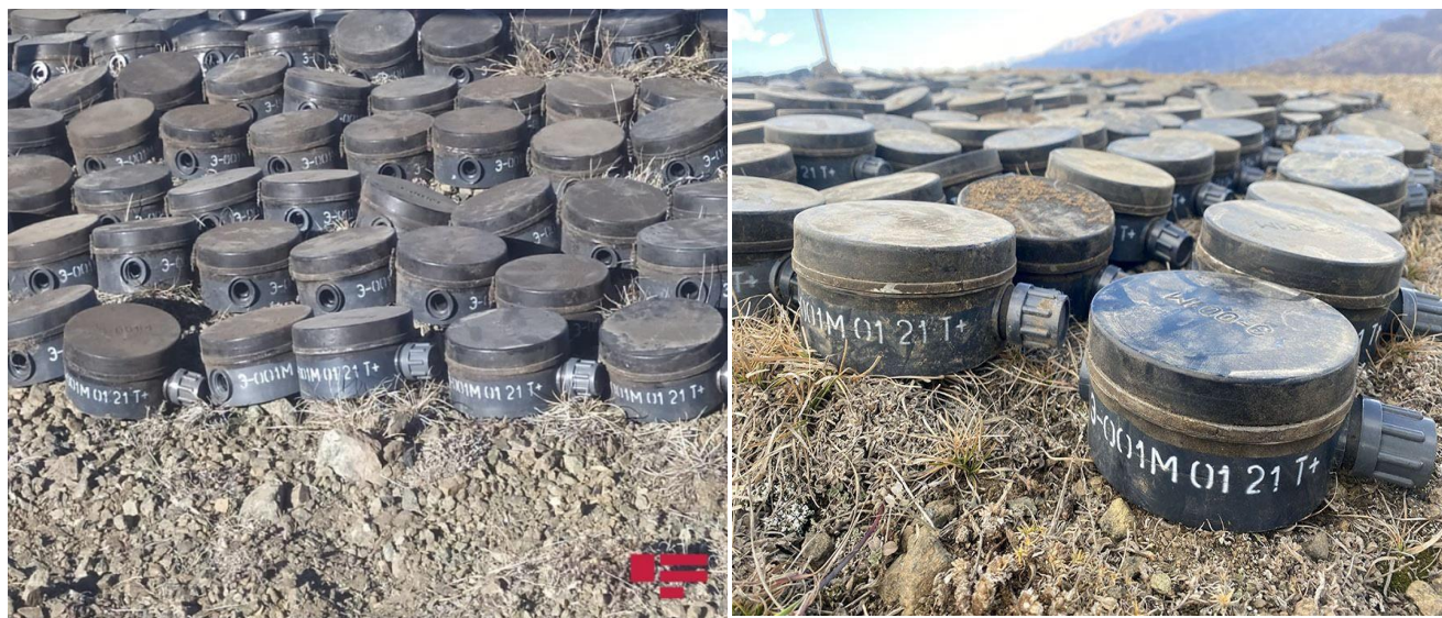
Photos 5-6: Clearance of minefields from Armenia-produced landmines