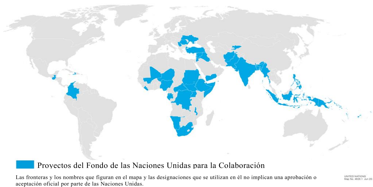
Figura II Proyectos del Fondo de las Naciones Unidas para la Colaboración Internacional en 2020 a

Nota: La línea de puntos representa aproximadamente la línea de control en Jammu y Cachemira convenida por la India y el Pakistán. El estatuto definitivo de Jammu y Cachemira aún no ha sido acordado por las partes. La frontera definitiva entre el Sudán y Sudán del Sur no se ha establecido todavía. Existe una disputa de soberanía entre los Gobiernos de la Argentina y el Reino Unido de Gran Bretaña e Irlanda del Norte respecto de las Islas Malvinas (Falkland Islands).