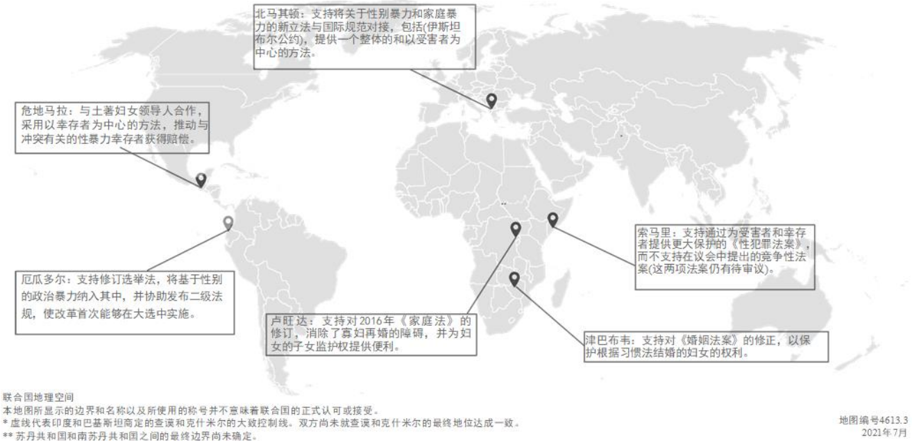
图三 支持妇女女童的安全和正义