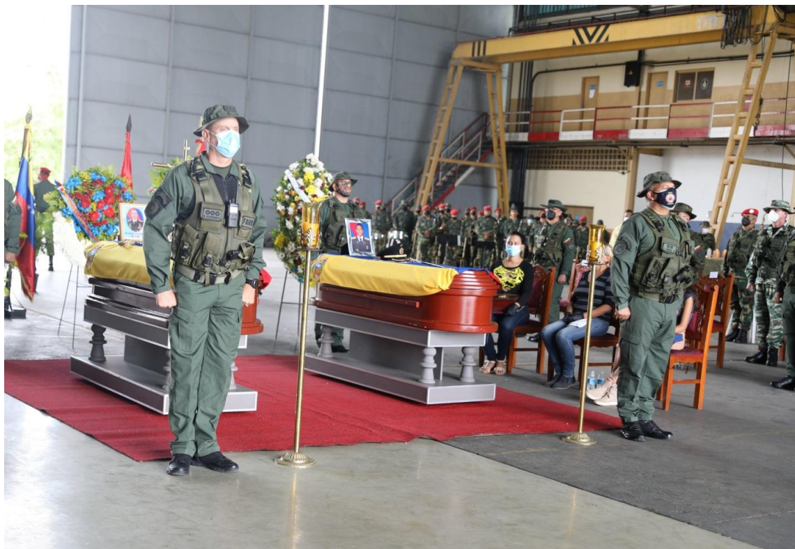
在阿普雷州里帕尔(委内瑞拉)，委内瑞拉坦克遭攻击： 4