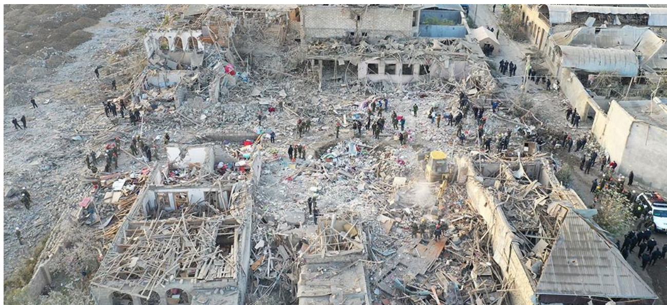
图片 28-31：住宅楼和平民财产