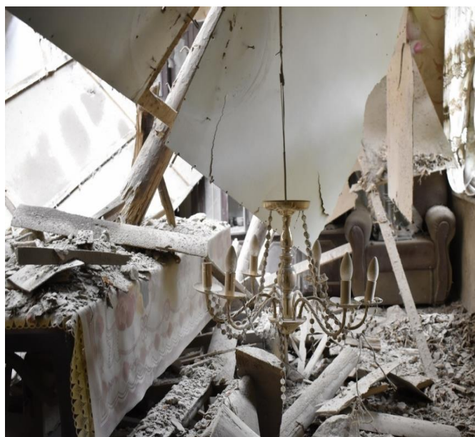
图片 1-14: 私人房屋