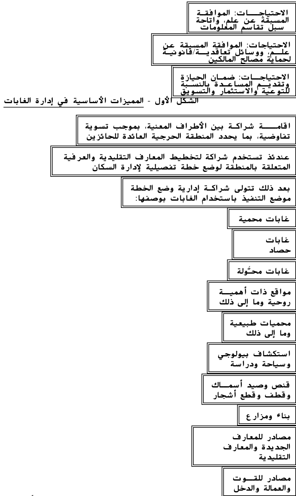
الشكل الثاني - إدارة المناطق الحرجية المأهولة