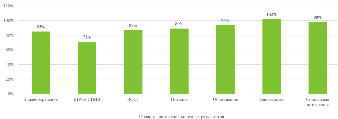
Диаграмма II Средний показатель выполнения целевого задания в сопоставлении со Стратегическим планом на 2016 год