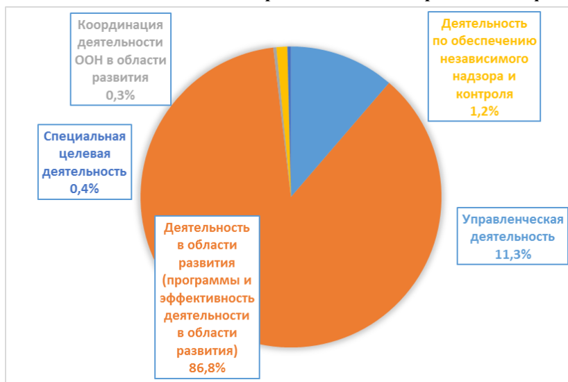
Диаграмма 2. Сводный бюджет на 2022–2025 годы в разбивке по категориям классификации расходов

15. Предлагаемое использование ресурсов, приведенное на диаграмме 2, показывает процентную долю ресурсов, выделенных согласно категориям классификации расходов, а именно: на деятельность в области развития; управленческую деятельность; специальную целевую деятельность; деятельность по обеспечению независимого надзора и контроля; и координацию деятельности Организации Объединенных Наций в области развития. ЮНФПА продолжает направлять значительную часть своих ресурсов целевым образом на деятельность в области развития.